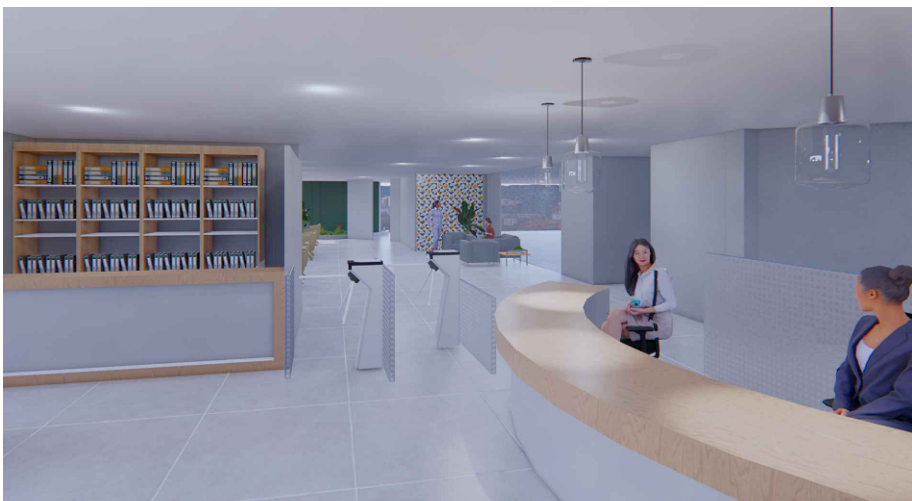
VISTA 2 - PROTOCOLO