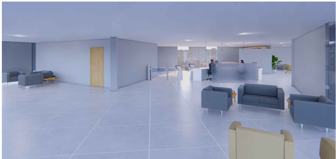
VISTA 5 - ÁREA DE ESPERA