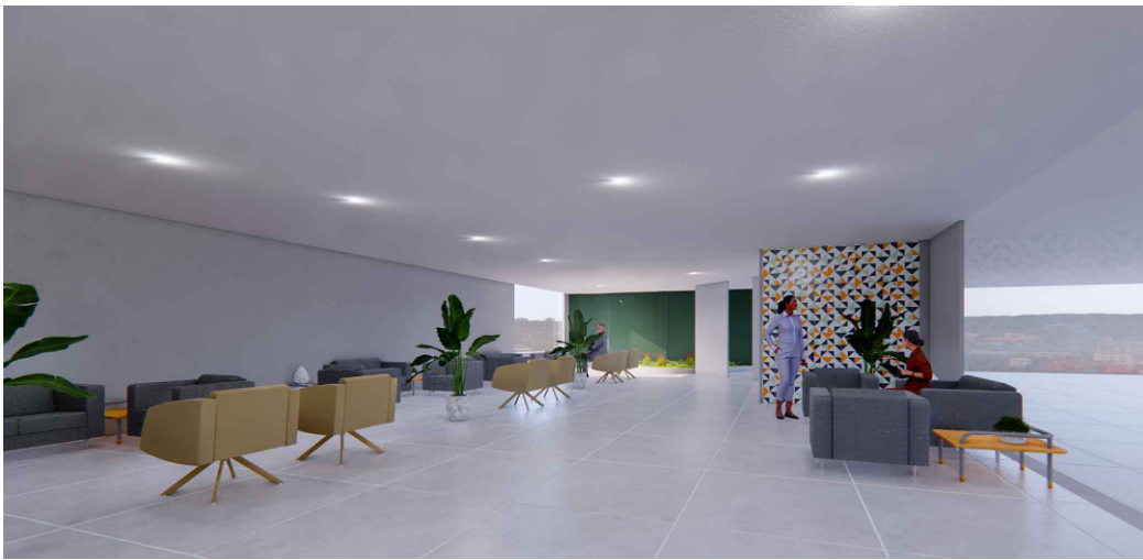
VISTA 3 - ÁREA DE ESPERA