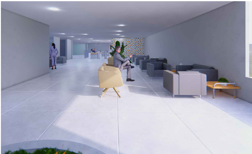
VISTA 4 - ÁREA DE ESPERA